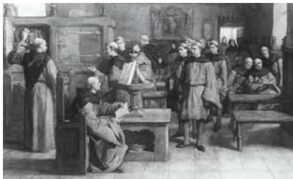
Geromantiseerde weergave van Geert Grote met zijn volgelingen

Inloop vanaf 14.00 uur. Na de pauze gelegenheid tot vragen stellen/discussiëren. Einde bijeenkomst 16.45 uur.