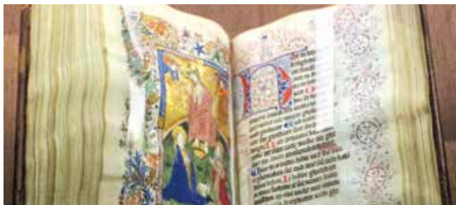
Libro d'ore van Geert Grote

De volgende inleiders nemen u mee op reis door een boeiende geschiedenis die zal eindigen met de conclusie dat het gedachtegoed van de Moderne Devotie meer dan ooit een inspiratiebron kan zijn in de huidige tijd.